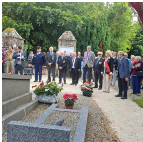
Les cérémonies du 80 ème anniversaire du débarquement à Gratot (Rond point du Gros Frène et cimetière de l'église de Gratot)