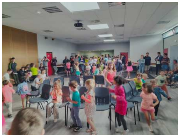
Apéro boum – 02-07-24