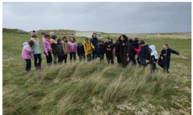
La classe de mer à Saint Martin de Bréhal – 28 et 29 mars

Lors de la kermesse, qui a eu lieu le vendredi 14 juin, les élèves de l'école du RPI ont pu faire leur chorale devant leurs familles sous une petite pluie fine. Heureusement, le soleil est revenu juste après, afin que les personnes venues puissent profiter des jeux, des grillades et de la buvette !