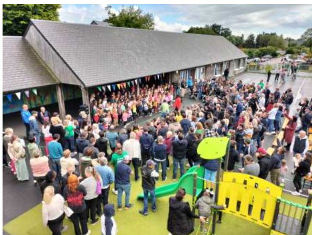
Kermesse – 14-06-24