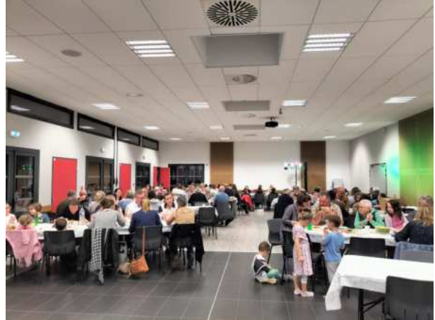
Le repas de l'APE – 13-04-24

Le 23 février a eu lieu le défilé du carnaval des élèves de l'école dans les rues de Gratot.