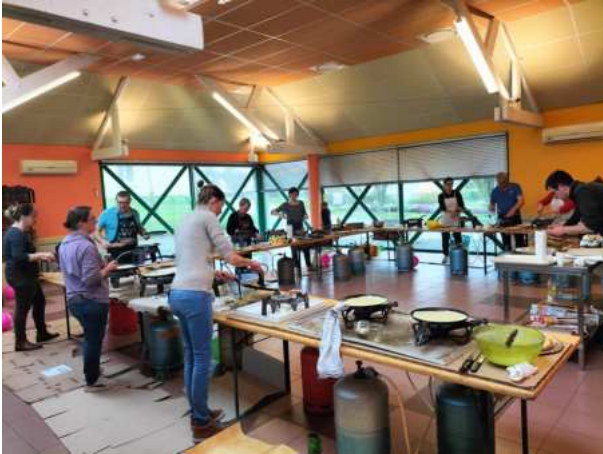
La soirée crêpes – 21-02-24