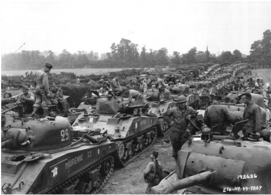
La 2ème DB attendant les ordres de mouvement