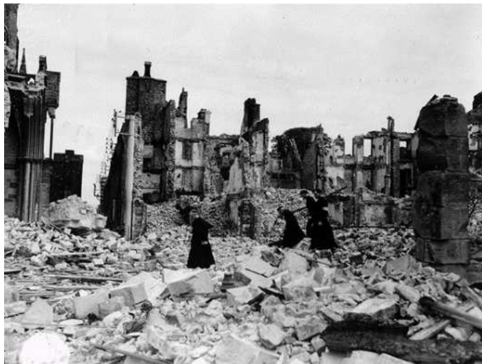
Des séminaristes dans la rue Geoffroy de Montbray

Le 6 juin et le 13 juin 1944, Coutances est bombardé par l'aviation alliée. Bilan : plus de 300 civils tués, 612 maisons entièrement détruites ,1300 très endommagées ; tout ça pour une vingtaine de victimes allemandes. Les Coutançais fuient dans les communes avoisinantes. Le sauvetage des blessés, les inhumations des morts sont assurés dans des conditions épouvantables et traumatisantes par quelques courageux Coutançais parmi lesquels de jeunes séminaristes. L'un d'eux, Raymond LECHAPELAIN deviendra curé de Gratot en 1957.