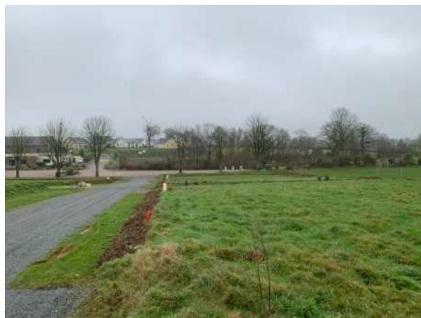
Les aménagements paysagers du lotissement des Marronniers