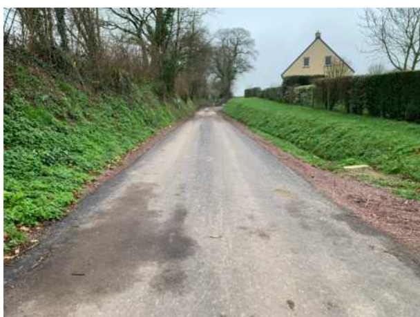
Réfection voirie rue de la Fée Andaine