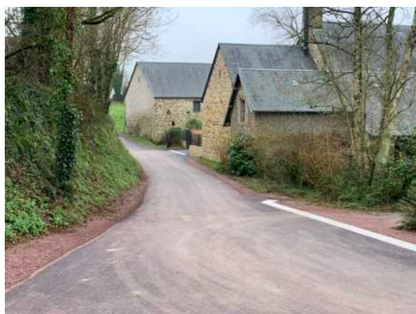
Réfection voirie à La Foubardière