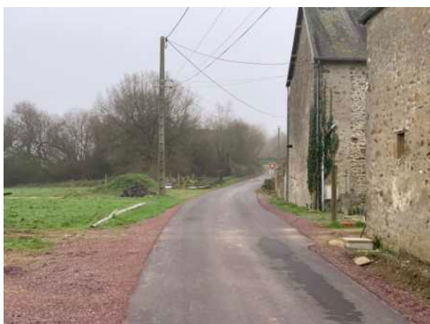
Réfection voirie à La Grandinière