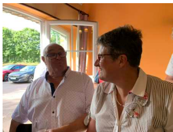
Gratot, le 26 août 2024 pour un clap de fin