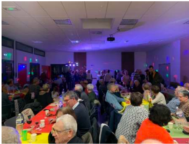
L'ambiance est là !