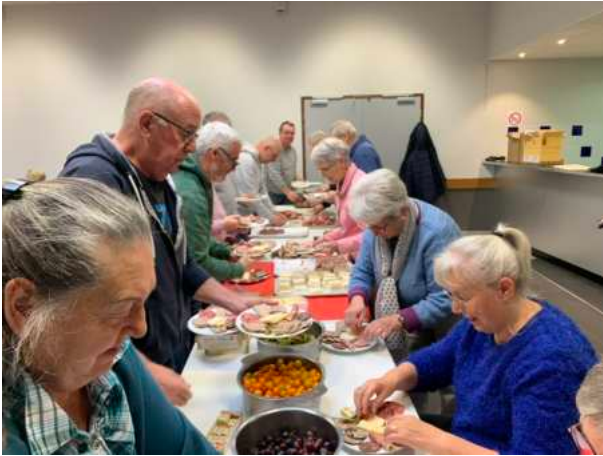
La préparation des assiettes de charcuterie