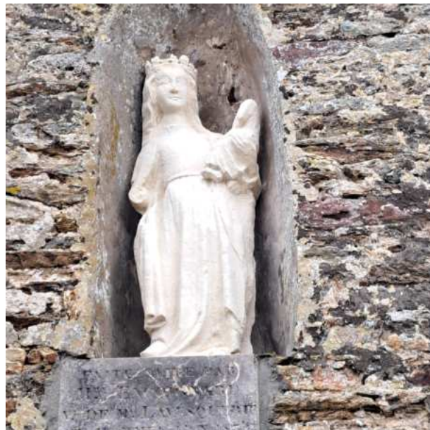
Restauration de la statue de la Vierge et réalisation de sa copie