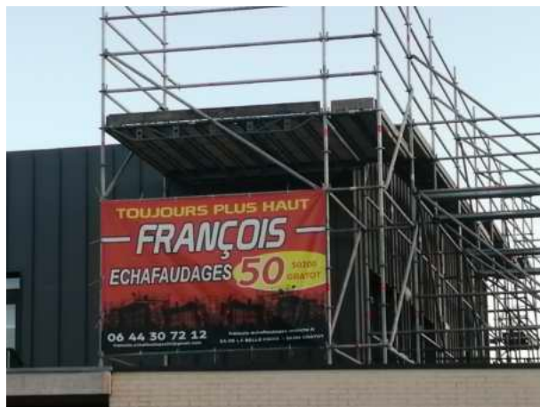
Une nouvelle entreprise dans la ZA