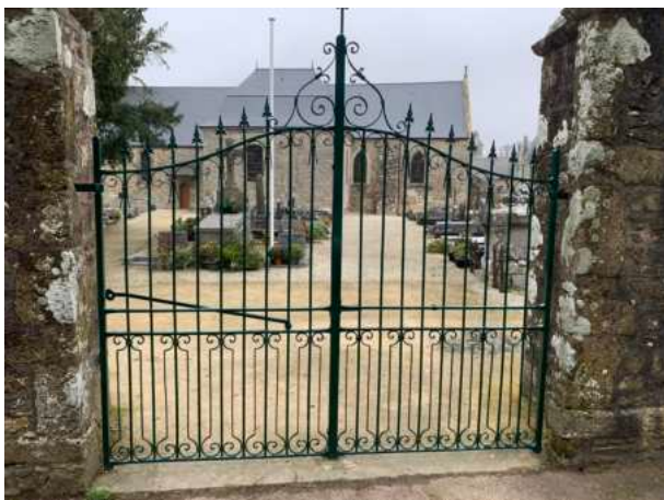
Le portail du cimetière rénové