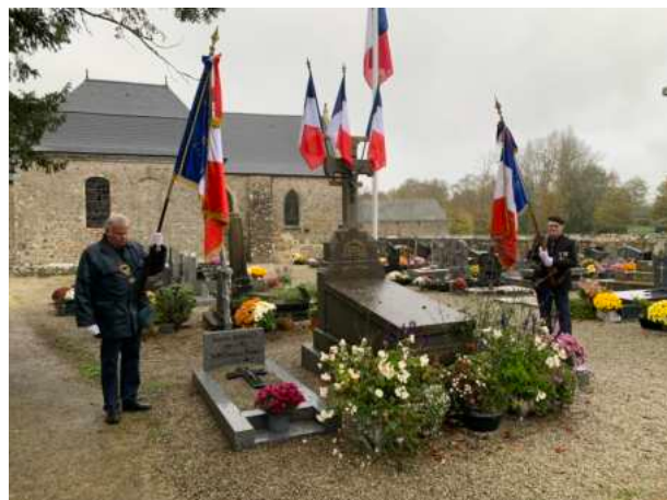
La cérémonie du 11 novembre