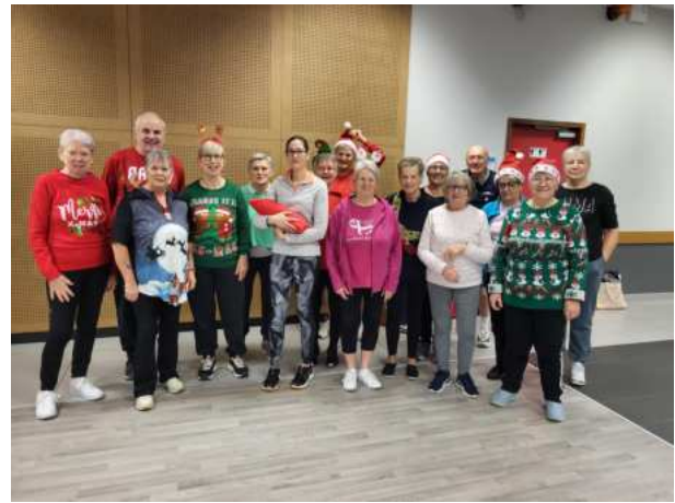
Les gymnastes de Gratot sont en forme

Activité GYM : 25 adhérents. Les cours sont toujours assurés par l'association Siel bleu.