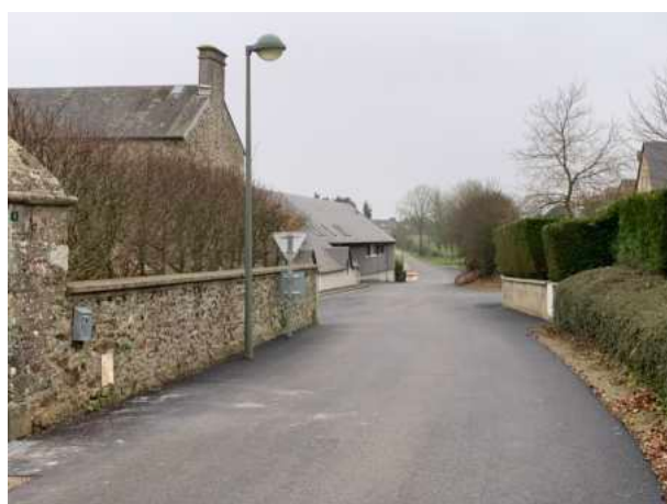
Réfection voirie rue de La Pitonnerie