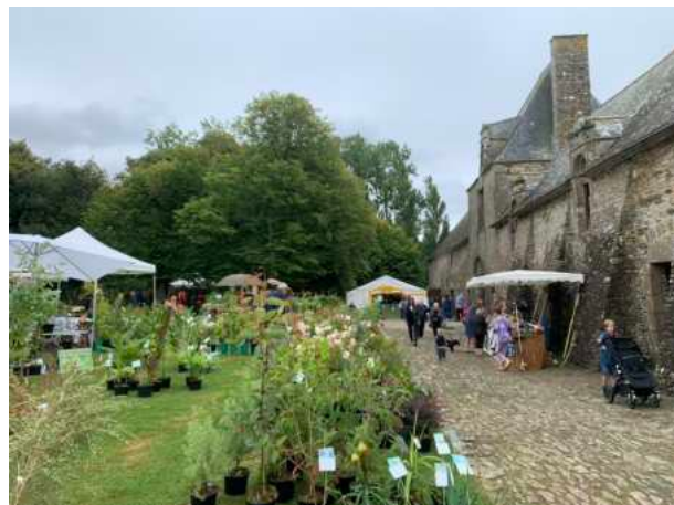
A propos de jardin – Août 2024