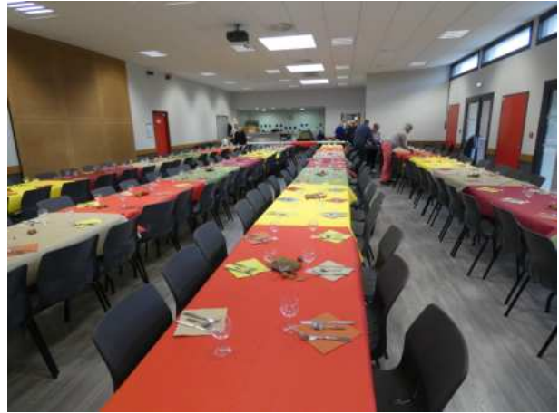
La préparation de la salle