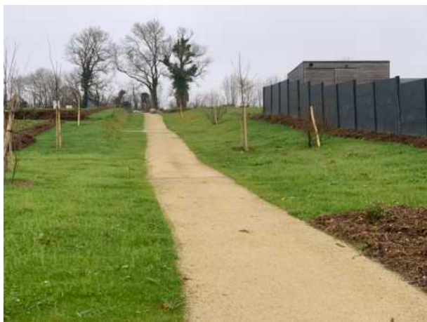
La coulée verte du lotissement des Marronniers

Le mot du maire a fait état des travaux réalisés dans la commune. Nous les illustrons en photos ci-dessous.